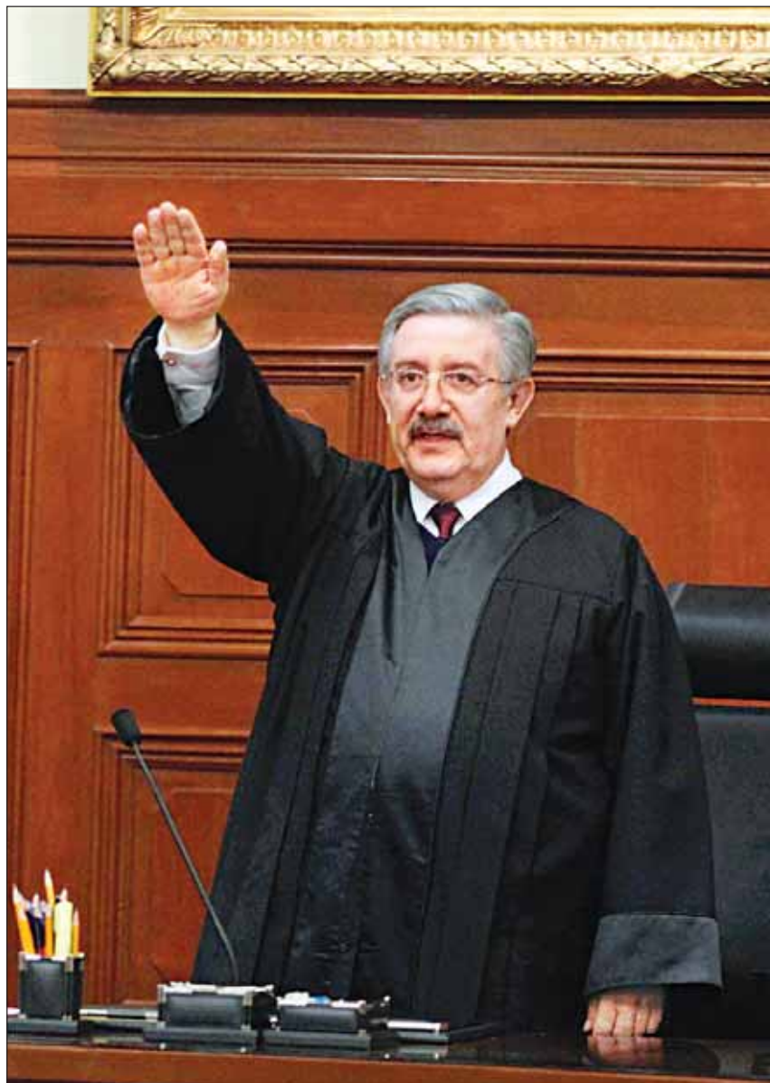
En sesión maratónica, los ministros de la Suprema Corte de Justicia de la Nación efectuaron 32 rondas de votación para elegir a su nuevo presidente, Luis María Aguilar Morales, quien al rendir protesta se comprometió a impulsar el respeto a los derechos humanos, así como a "evitar la arbitrariedad de cualquier autoridad". Su principal contendiente fue Arturo Zaldívar Lelo de Larrea. Fuentes judiciales previeron que no habrá grandes cambios en el máximo tribunal