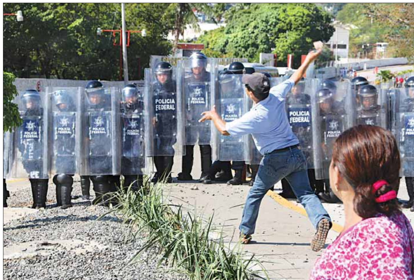
Unos 150 profesores se enfrentaron en el istmo de Tehuantepec con policías federales durante la visita del presidente Enrique Peña Nieto al estado. Los mentores lanzaron piedras a los agentes, quienes respondieron con gas lacrimógeno. En tanto, el mandatario sostuvo que este año se percibirán los efectos de las reformas estructurales; agregó que los mexicanos serán los jueces que evaluarán los beneficios de esas enmiendas