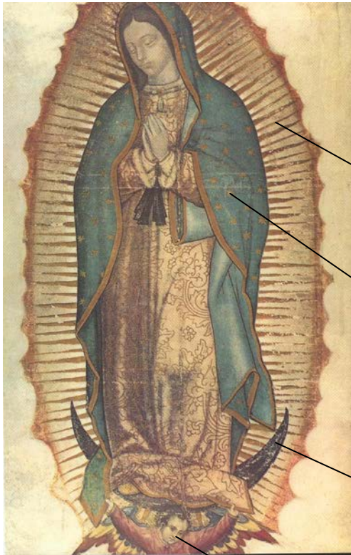
Guadalupe Mexicana 1555