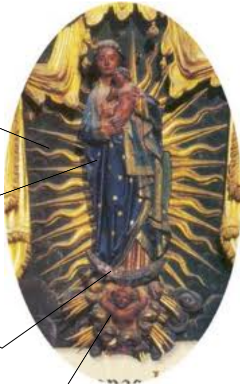
Guadalupe Española 1300